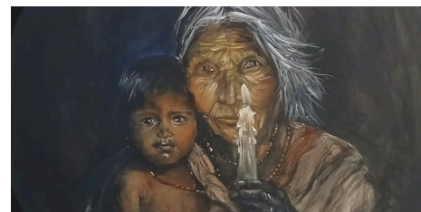
Acrilico su tela 90x90 cm - Fulvia Francesca Rocca

Il fine dell’Amore è amare; niente di più e niente di meno”.